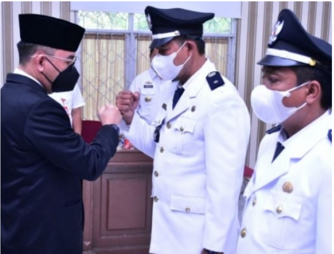
Raden adipati lantik pj kakam dan kakam definitif kec. Rwbang tangkas dan pakuan ratu

Way Kanan -- Sistem Penyelenggaraan Pemerintahan di Indonesia, sesuai dengan UU Nomor 6 Tahun 2014 tentang Desa, maka Pemerintah Kampung sebagai unsur terdepan yang harus mampu memberikan pelayanan kepada